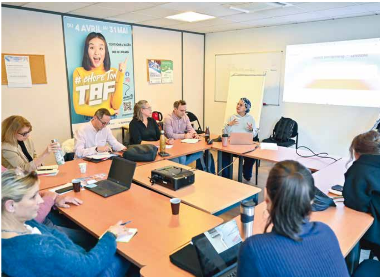
↑ Une dizaine d'entrepreneurs ont participé à l'atelier de l'IA au service du marketing digital, le 8 décembre dernier.